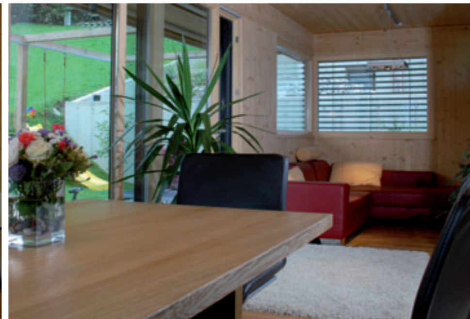
Couchzone im offenen Ess-Wohnbereich.

den hinteren Raum der geteilten Küche in Nussholzoptik. So werden Kilometer gespart und praktische Abstellereinheiten erzeugt. Wunderbar duftend präsentiert sich das Haus, denn die unbehandelten Fichtenwände im Inneren garantieren nicht nur weiche Gemütlichkeit, sie riechen nach frischem Holz. Ein eigenes Fernseh- und Rückzugszimmer findet auch noch Platz im Erdgeschoss.