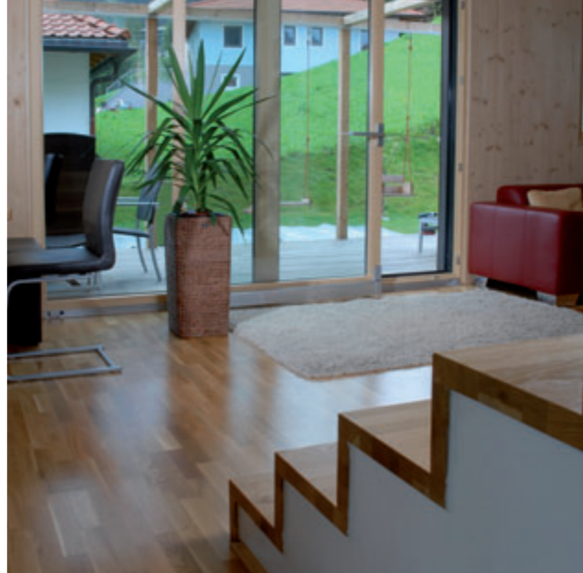
Viel spielt sich auf der Terrasse des Hauses ab.