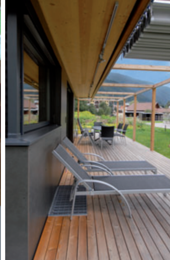
Eine Berlustrade mit selbst konstruiertem Sonnenschutz erweitert den Wohnraum in die Natur hinaus.