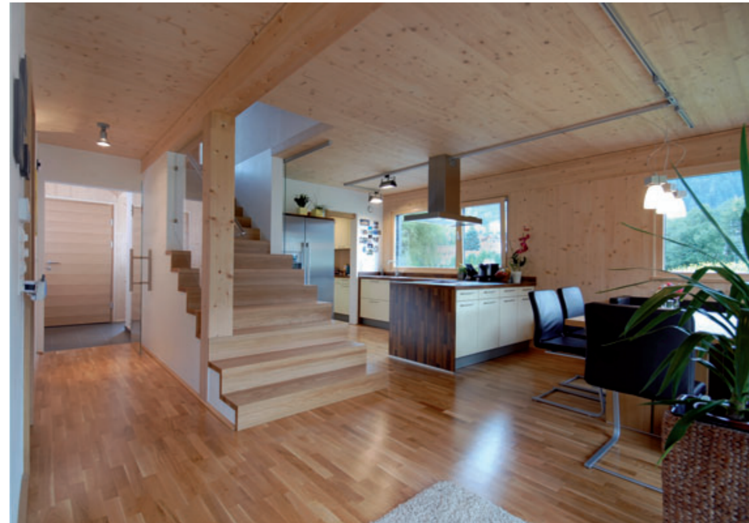
Der Wohnkubus in Steinach punktet mit einer Fotovoltaik-Fassade und viel Holz. Fenster, Beschattung und Garagentor realisierte Zoller & Prantl.