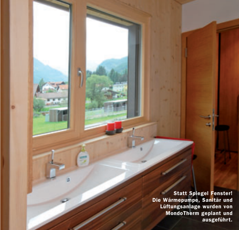
Statt Spiegel Fenster! Die Wärmepumpe, Sanitär und Lüftungsanlage wurden von MondoTherm geplant und ausgeführt.