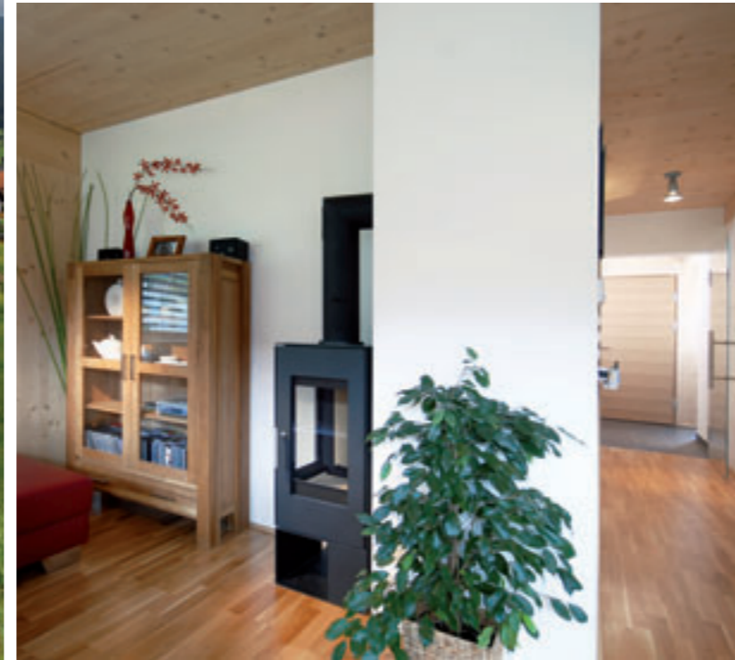
Sanfte Holztöne innen und außen. Ein schwenkbarer Kaminofen von MondoTherm sorgt für Gemütlichkeit.