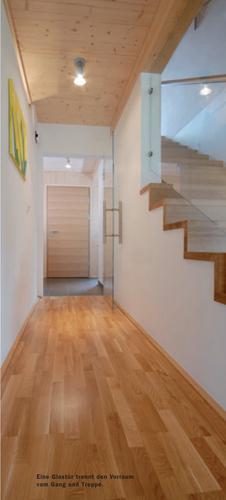
Eine Glastür trennt den Vorraum vom Gang und Treppe.