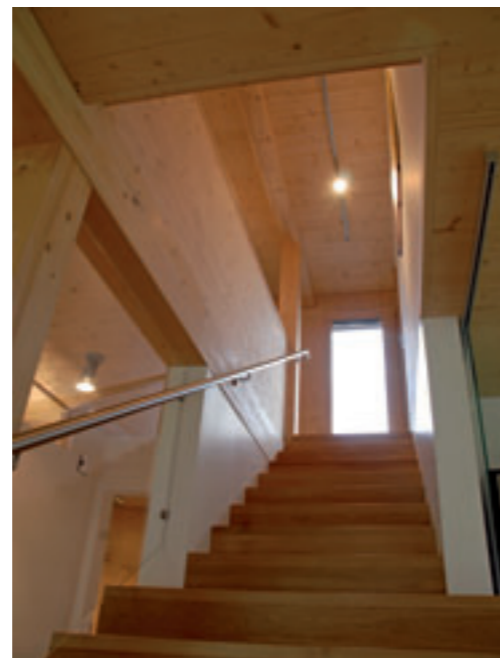
Die Holzstiege verbindet die Geschosse.