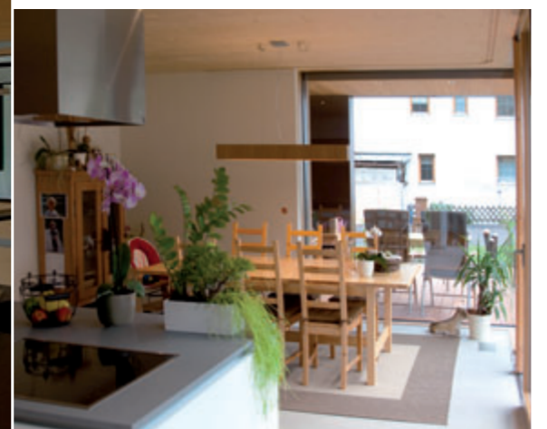
So nah am Garten kann man nur mit raumhohen Verglasungen leben. Die Küche geht in den Essbereich über.