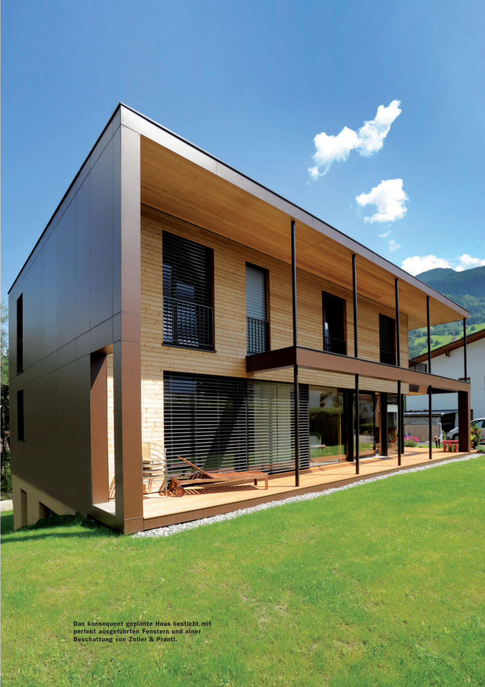
Das konsequent geplante Haus besticht mit perfekt ausgeführten Fenstern und einer Beschattung von Zoller & Prantl.

Im Erdgeschoss ging sich noch ein Büro aus. Eine Eichenholztreppe erschließt den oberen Teil des Passivhauses. Zwei Kinderzimmer, das Elternschlafzimmer, zwei Bäder, Eichenholzböden, der Wäscheabwurf und eine Galerie mit Berg- und Waldblick vervollständigen das Obergeschoss. Der kompakte Hausquader weist hervorragende Dämmwerte dank Zellulose- und Schafwolldämmung auf. Die Schafferer Massivholzbauweise, die Wohnraumlüftung mit Feuchterückgewinnung und die mit sandfarbenem Lehmputz versehenen Innenwände managen den Feuchtigkeitsgehalt in der Luft. Die komfortable Fußbodenheizung und die Warmwasseraufbereitung wird mit thermischer Solarenergie und einem eigens von den Spezialisten der Firma Schafferer, der Firma MondoTherm, dem Energieberater Gstrein Hannes und vom Bauherrn gemeinsam ausgetüftelten System betrieben, das für ausreichende Speicherung dank einer aktivierten Betonwand im Kellergeschoss und Erdgeschoss sorgt. Nur mit der kontrollierten Wohnraumlüftung pendelt sich die Temperatur auf konstante 20° ein. Durch die Fußbodenheizung wird die Temperatur dann entsprechend den Bedürfnissen auf ▶