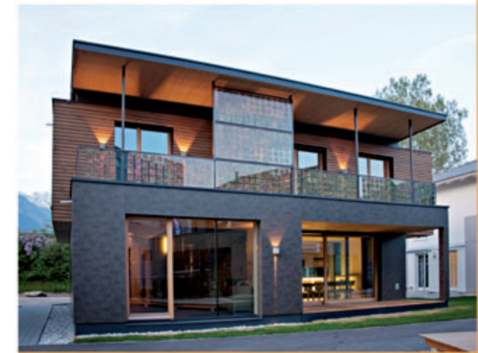
Hier entsteht ein Traum aus Holz...