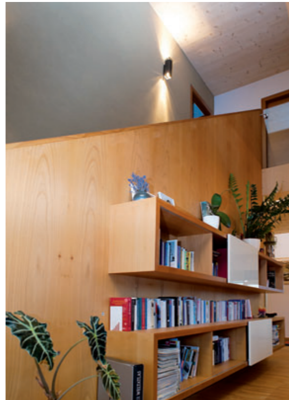
Das Bücherregal wurde in die Treppenwand integriert.

Ausstattung seine Entsprechung. Ein geniales Lichtband übers Eck erweitert die Sicht aus der Küche wie auf einem Hochstand. Vom Schlafzimmer im Obergeschoss sieht man direkt auf die Serles und den Sonnenstein, das Lärchenholzfenster im nordseitigen Büro rahmt den Ampferstein und von der Terrasse aus blickt einem Habicht und Elfer entgegen. „Wir haben je nach Tageszeit drei Sitzplätze an der Sonne“, schmunzelt die Bauherrin. Die kompakte Lösung unter der eleganten horizontal gelatteten Fassade des Hauses bietet im Keller viel Staufläche, im Erdgeschoss offenes Wohnen und unter dem leicht geneigten Pultdach neben dem perfekt organisierten Schlaf-Badbereich noch Platz für das Musikzimmer des Bauherrn. „Es ist wirklich alles besser geworden als wir je geglaubt haben“, resümieren die Bewohner zufrieden. ■