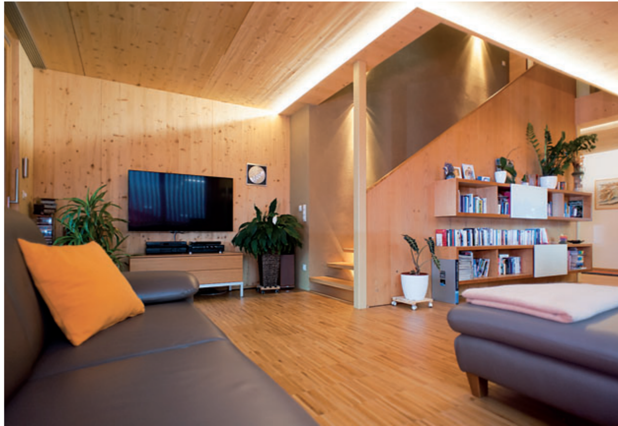
Holz bestimmt auch den Innenraum.

planten nach den klaren Raumprogramm-Vorstellungen der Bauherren ein zweigeschossiges Haus mit vollständiger Unterkellerung samt Carportteil und einem übergangslos in den Garten reichenden geschützten Terrassenbereich. Mit modernster Technologie maßgeschneidert, millimetergenau vorgefertigt und mit effizientesten Montagethoden arbeitend, wurde in drei Tagen der Rohbau von Schafferer Holzbau aufgestellt. „Das war schon beeindruckend, wie stressfrei und präzise das vor sich ging“, lobt die Bauherrin die verlässlichen Bauprofis aus Navis. Inzwischen konnte das Wohngefühl im neuen Haus ausgiebig