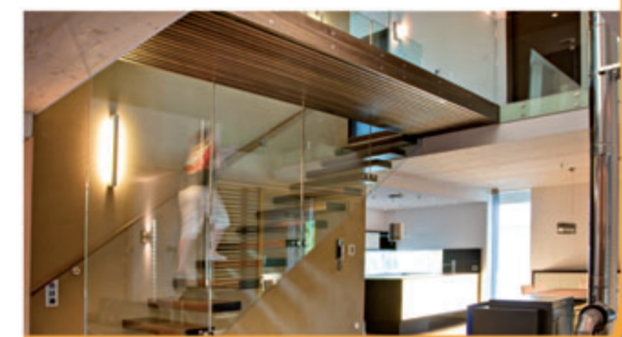
Besuchen Sie uns in unserem Musterhaus im Energiehauspark in Innsbruck. (Ausfahrt DEZ)