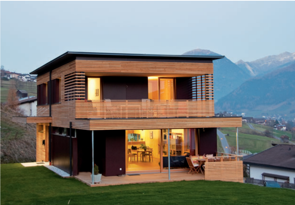
Dem Einfamilienhaus liegt ein Plan der teamk2 architects zugrunde und es wurde von den Schafferer Holzbau-Profis maßgeschneidert umgesetzt.

Kind von einem eigenen Holzhaus. Die Naviser Holzbau Schafferer-Experten waren uns seit langem vertraut und ihre Referenzen überzeugten ebenso wie die jahrzehntelange Erfahrung. Vor allem aber hatten wir großes Vertrauen in ihren hohen Qualitätsstandard beim individuellen Massivholzbau.“