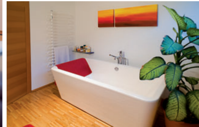
Sanitärinstallation und -ausstattung durch die Firma MondoTherm aus Ötztal-Bahnhof.

schützt. Das Heimspiel mit Holz setzt sich natürlich auch im Inneren fort. Wände und Decken in heller Fichte, der Boden, die skulpturale Treppe und die Möbel aus Kirsche – das erzeugt ein Wohnklima der Extraklasse. Nicht nur der Holzduft stimmt fröhlich, auch der Mix aus den wenigen Materialien mit einer Feuchtigkeit regulierenden Lehmwand generiert ein besonderes Feeling – sehr, sehr nah an der Natur.