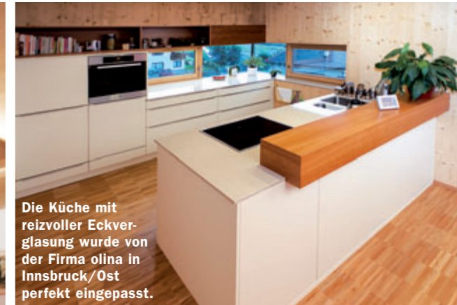
Die Küche mit reizvoller Eckverglasung wurde von der Firma oлина in Innsbruck/Ost perfekt eingepasst.

Das Architektenhaus als Schafferer natürlich MASSIVHOLZ-HAUS wurde in individueller Holzbauweise errichtet, ist modern, offen, praktisch und funktionell. Der lange, schmale Baugrund eignet sich bestens für den quaderförmigen Baukörper, der in Lärche gehüllt ist und durch vorkragende Holzdecken auch Terrasse und Balkon-Loggia perfekt vor Sonne und Regen