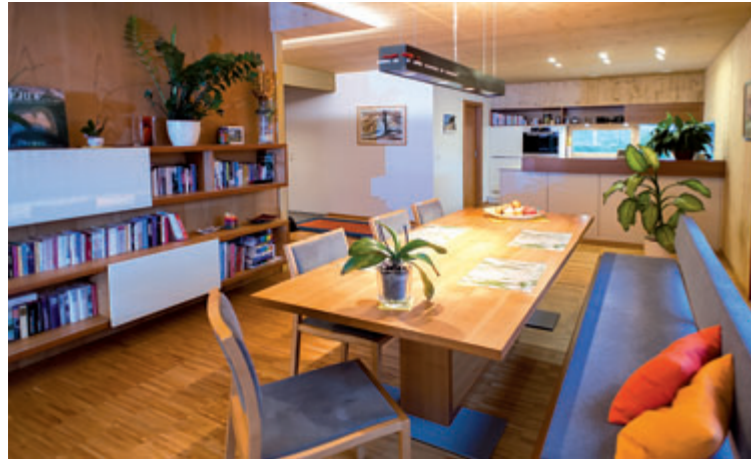
Eine gemütliche Banklösung für den Essplatz bringt variable Sitzplätze.