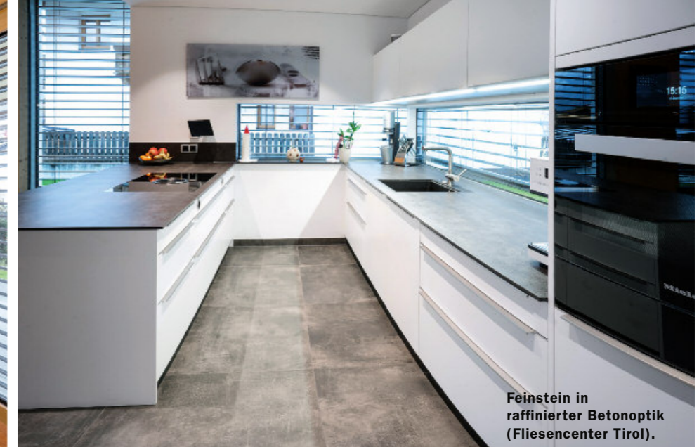
Feinstein in raffinierter Betonoptik (Fliesencenter Tirol).