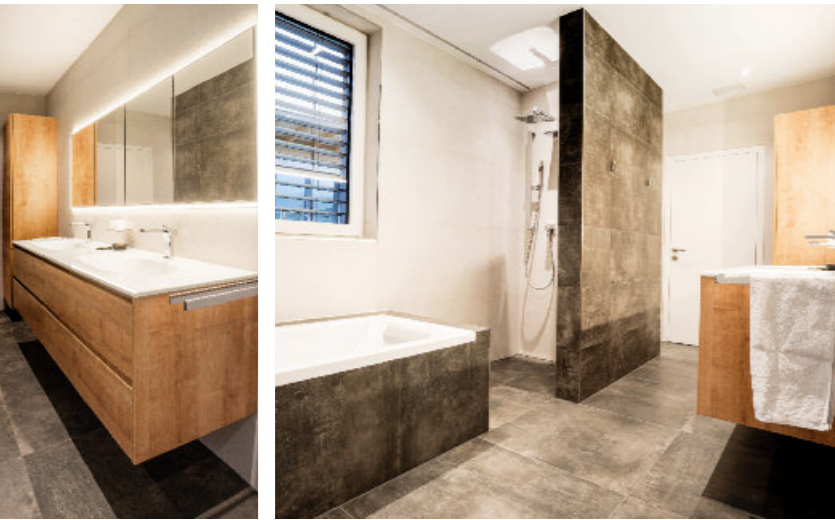
Badinstallation, kontrollierte Wohnraumlüftung und Luft-Wasser-Wärmepumpe setzte die Firma GHW Installateur GmbH/Telfs um.

Fliesen in trendiger Betonoptik verfügt unter anderem über eine Regenwalddusche und einen praktischen Wäscheabwurf. „Unser Wohnraum ist zu hundert Prozent mit dem SchafferernatürlichMassivHolzHaus umgesetzt“, resümieren die Bauherren. „Wir profitieren vom Ergebnis 20-jähriger Erfahrung, die das Naviser Expertenteam bei der Entwicklung und Umsetzung von Massivholzhäusern gesammelt hat. Da passt das Verhältnis von Preis-Leistung und man fühlt sich zu jeder Tageszeit geborgen in Holz.“ ■