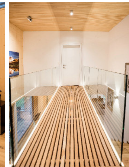
Eine Brücke aus Holz dient der Erschließung.