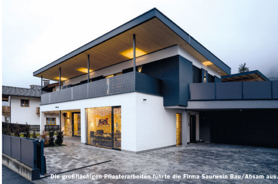
Die großflächigen Pflasterarbeiten führte die Firma Saurwein Bau/Absam aus.