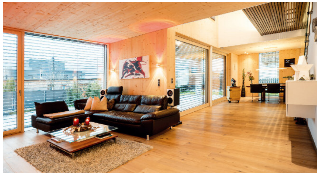
Der sonnedurchflutete Wohnbereich wurde mit eleganten Landhausdielen der Parkett-AGENTUR/Leutasch ausgestattet.