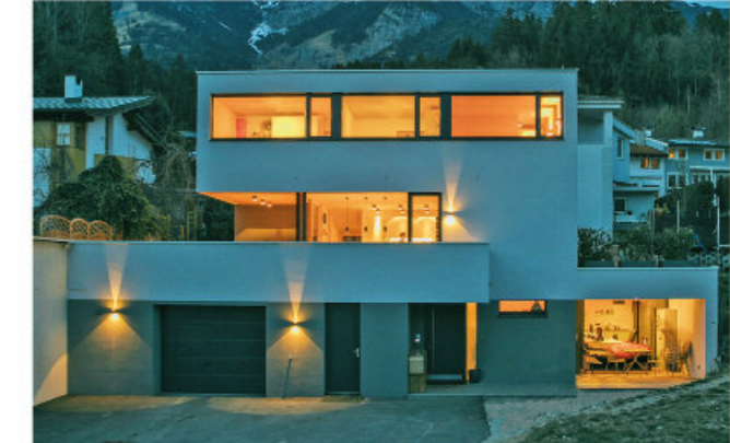
Hier entsteht ein Traum aus Holz...