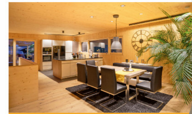
Besuchen Sie uns in unserem Musterhaus im Energiehauspark in Innsbruck. (Ausfahrt DEZ)