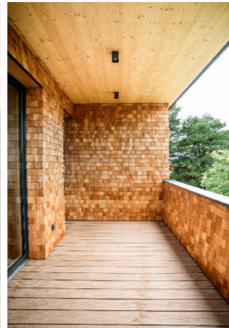
Kontrastreiche Fassade durch Schindeln der Firma Astner Holzschindeln in Wiesing.