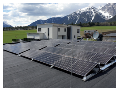
Auswahl an Photovoltaikanlagen

Die TyrolPV Elektrotechnik GmbH ist auf Photovoltaik konzentriert und ist ein Komplettanbieter von A bis Z. Die Zufriedenheit des Kunden, saubere und hoch qualitative Arbeit mit hochwertigsten Produkten zu fairen Preisen stehen hier im Vordergrund.