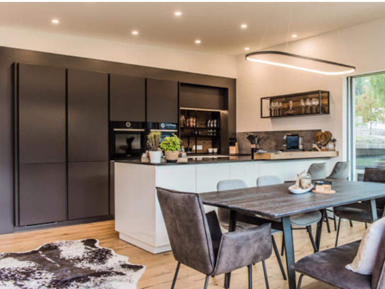
Sehr gemütlich – die moderne Küche von DAN Küchen Leitner Telfs.