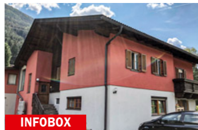
Aus dem Einfamilienhaus entstand nach effizienter Umwandlungsphase ein überzeugender Baukörper mit beeindruckend viel Wohnfläche.