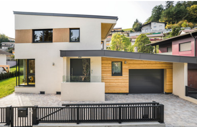
Maximaler Schutz mit einem stabilen Zaun der Firma Leeb.