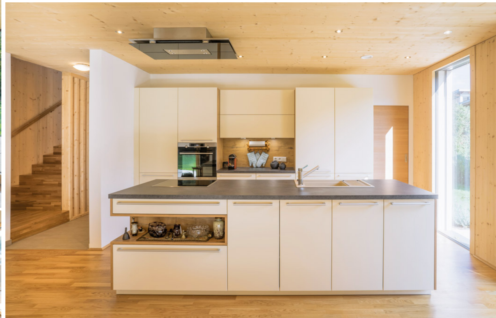
Ökologisches Ambiente und Sanitäres, sowie eine Luft-Wasser-Wärmepumpe samt kontrollierte Raumlüftung von der Firma Mondo Therm.